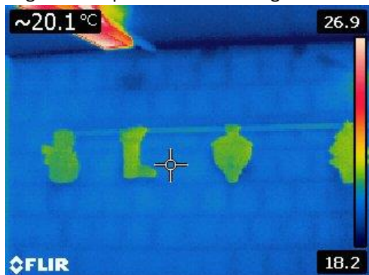
Figura 1.2 – Immagine termografica muro perimetrale

Sono state analizzate le pareti perimetrali e il solaio al fine di verificare la qualità dei vari componenti stratigrafici dal punto di vista energetico.