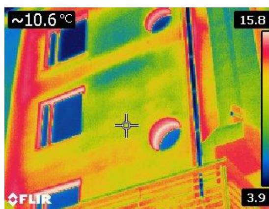
Figura 2.5 – Immagine termografica muro dall'esterno

La Figura 1.5, invece, mostra la prestazione termica dei serramenti e nella Figura 1.5 la differenza di dispersione termica tra l'involucro opaco e quello trasparente.